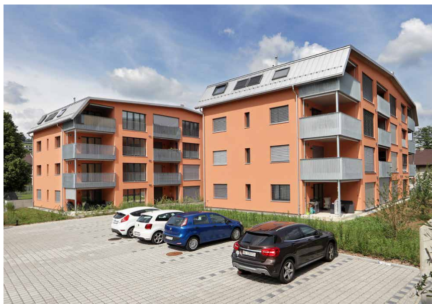
Eindrückliche Nachfrage: Die 24 modernen Wohnungen am Gelterkinder Zelgwasserweg 21 und 23 waren innert kürzester Zeit vermietet.

DIE PM MANGOLD HOLZBAU AG HAT ALS GENERALUNTERNEHMER IN GELTERKINDEN ZWEI MEHRFAMILIENHÄUSER MIT INSGESAMT 24 WOHNUNGEN ERRICHTET. DIE LIEGENSCHAFTEN SIND TEIL DES IMMOBILIENFONDS RAIFFEISEN FUTURA IMMO FONDS. DAS PROJEKT IST EIN EINDRÜCKLICHES STATEMENT FÜR MEHRFAMILIENHÄUSER AUS DEM WERKSTOFF HOLZ.