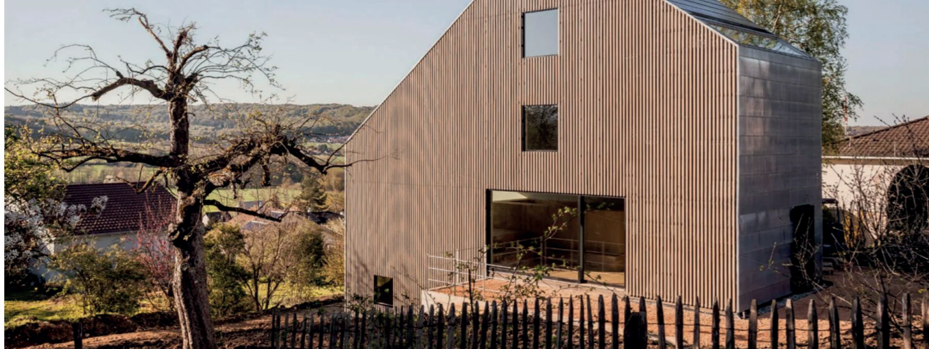
Aussenansicht eines in Rodersdorf errichteten Einfamilienhauses.

Unweit von Gelterkinden, im schönen Oberbaselbiet, entstehen Holzbauprojekte aller Art. Die PM Mangold Holzbau AG plant und realisiert seit über 40 Jahren Bauprojekte mit dem Baustoff Holz nach den individuellen Vorstellungen ihrer Kunden. Ein Familienunternehmen, welches sich das Bauen mit Holz zur Leidenschaft gemacht hat und ihr regionaler Partner für ihr nächstes Projekt.