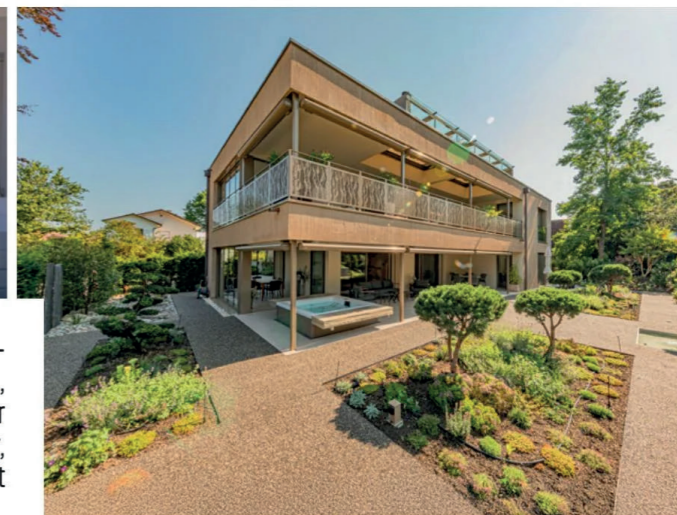
Das Mehrfamilienhaus in Holzbaugasse ergänzt sich perfekt mit der aufwändigen Gartengestaltung.

Werk in Kaiseraugst. Ob Treppe, Einbauschränk, Türen oder Holzmöbel, die Schreiner der PM Mangold Holzbau AG bearbeiten das Holz mit höchster Präzision und modernster Technik und sorgen so dafür, dass das entstehende Objekt künftige Besucher beim Betreten in Staunen versetzt. Höchste Präzision ist auch das Credo der Fachleute im Werk in Kaiseraugst. Die Abbundarbeiten und die Elementproduktion können in der modernen Werkhalle in Kaiseraugst bei jeder Witterung fortschreiten, was für die Bauherrn den Vorteil einer einzigartigen Terminalsicherheit bei der Umsetzung des Bauprojekts birgt. Auch für Kunden, welche ihr Wunschprojekt aus einer Hand verwirklichen wollen, hält PM die passende Lösung bereit. Als Generalunternehmer setzt die Firma Anbauten, Neubauten und Renovationen von den Planungsarbeiten bis zur Schlüsselübergabe um und arbeitet dabei eng mit regionalen Partnern zusammen, um den eigenen Qualitätsanspruch auch bei Fremdleistungen zu garantieren. Neben Termin- und Qualitätssicherheit bietet PM als Generalunternehmer stets auch Preissicherheit und achtet darauf, dass die Baukosten im erwarteten Rahmen bleiben. Die Firma ist immer auch an spannenden Grundstücken interessiert, auf welchen nachhaltige Bauprojekte für junge Familien oder jung gebliebene realisiert werden können.