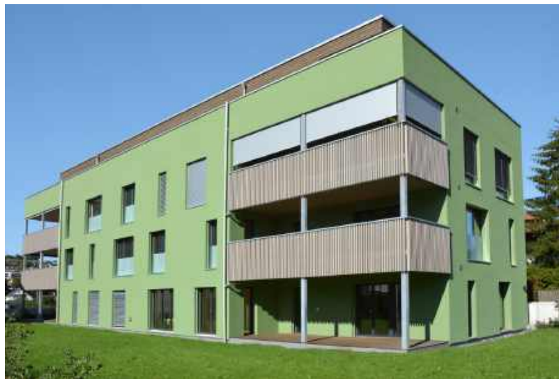
Mehrfamilienhaus mit 7 Eigentumswohnungen in Gelterkinden, Baujahr 2016 >

Leiter Investment Management, VERIT Investment Management AG (MFH-Projekt Zelgwasser in Gelterkinden)