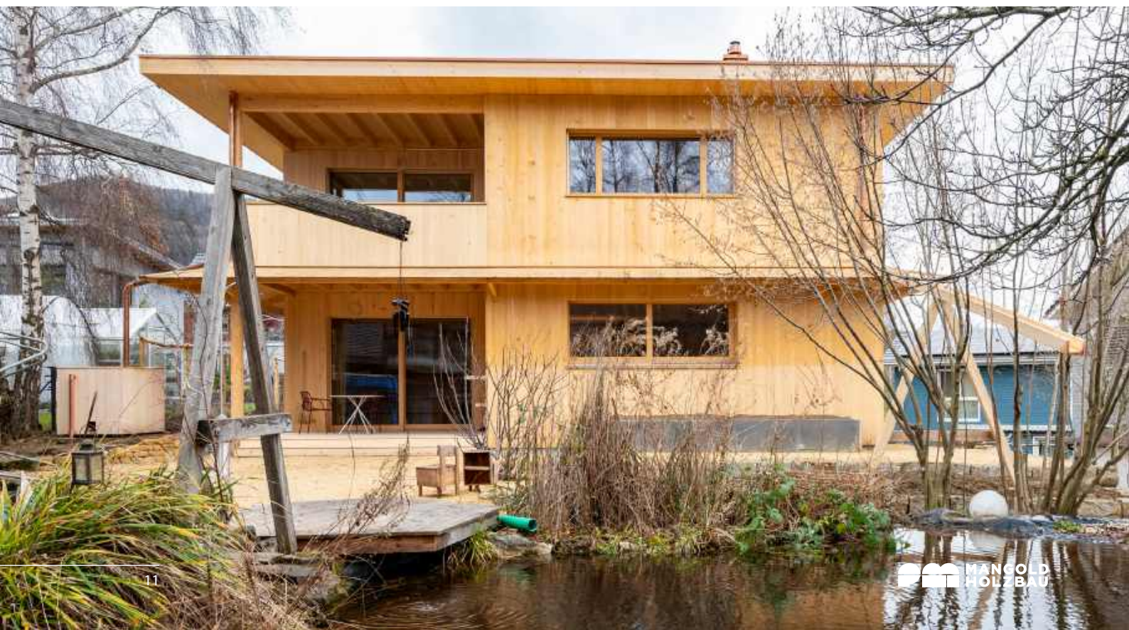
↓ Zweifamilienhaus in Ormalingen, Baujahr 2023