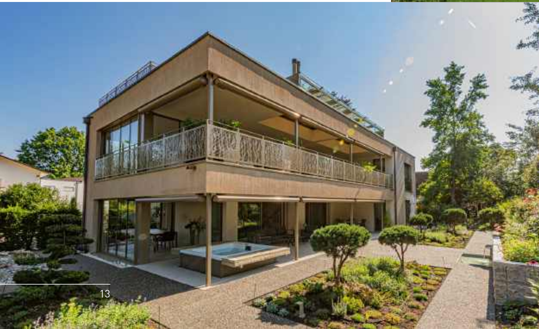
< Zweietagen-Villa in Rheinfelden, Baujahr 2020 Architektur und Totalunternehmer arco plus AG SIA, Rheinfelden