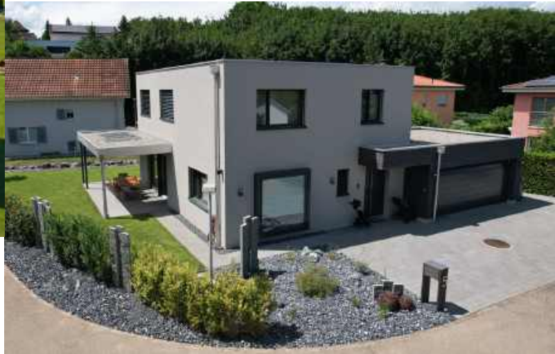
Wohnhaus in Wallbach, Baujahr 2022 >