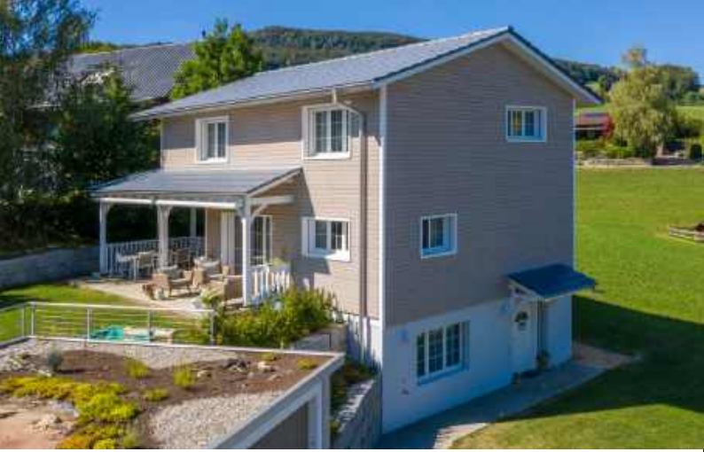
< Wohnhaus in Ormalingen, Baujahr 2017