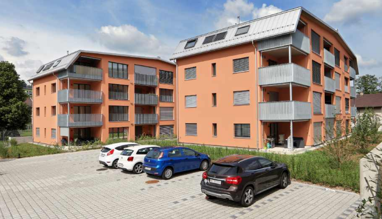
↑ Zwei Mehrfamilienhäuser mit 24 Mietwohnungen in Gelterkinden, Baujahr 2017

«TROTZ DES ENGEN ZEITPLANS WURDE DAS PROJEKT DREI MONATE VOR DEM OFFIZIELLEN TERMIN ÜBERGEBEN. WIR BLICKEN AUF EINE SEHR GUTE ZUSAMMENARBEIT MIT DER PM MANGOLD HOLZBAU AG ZURÜCK.»