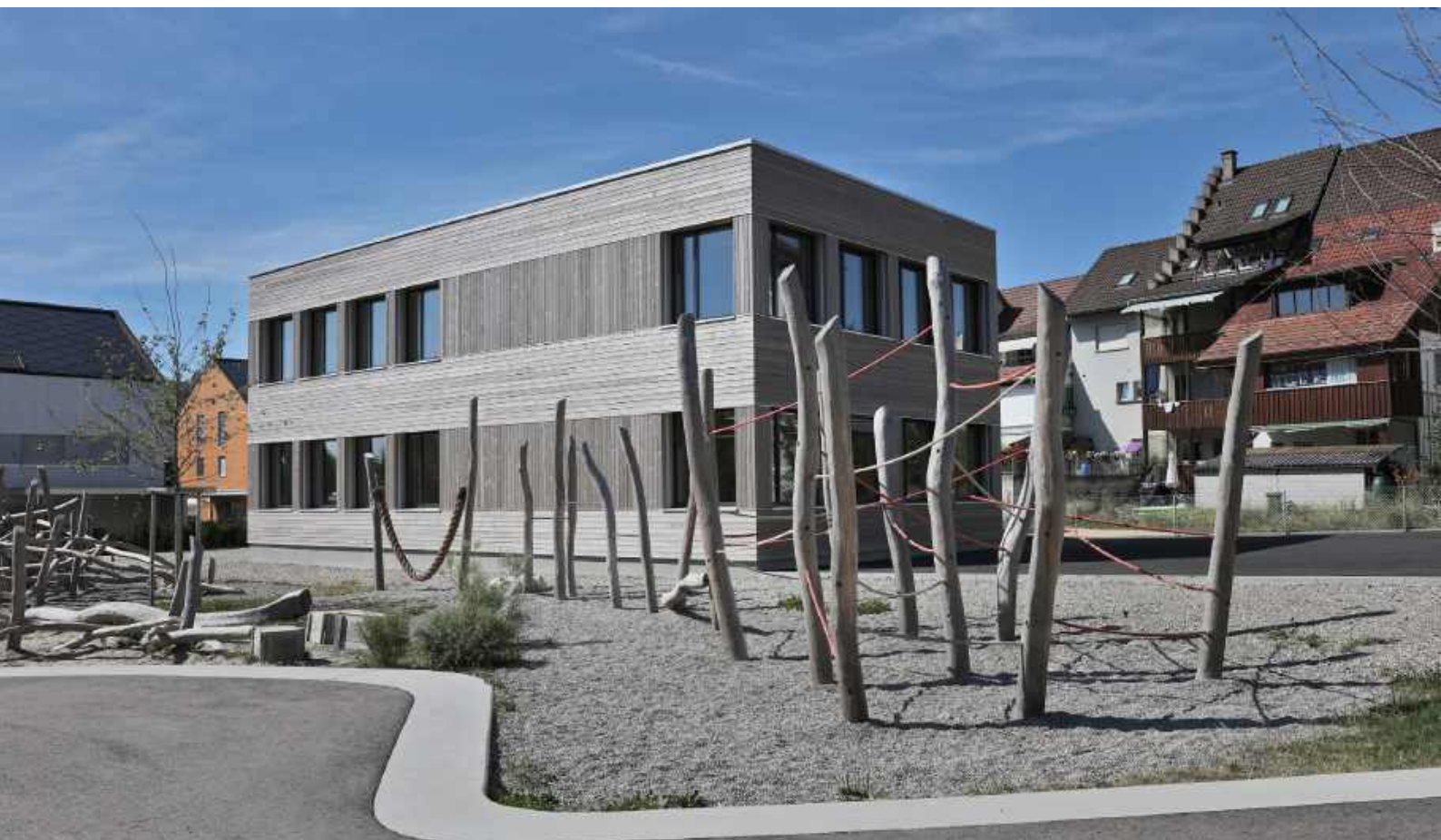
↓ Neubau Schulhaus Primarschule Ormalingen mit vier Klassenzimmern, Baujahr 2019