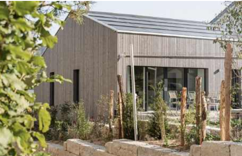
< Wohnhaus in Itingen, Baujahr 2023