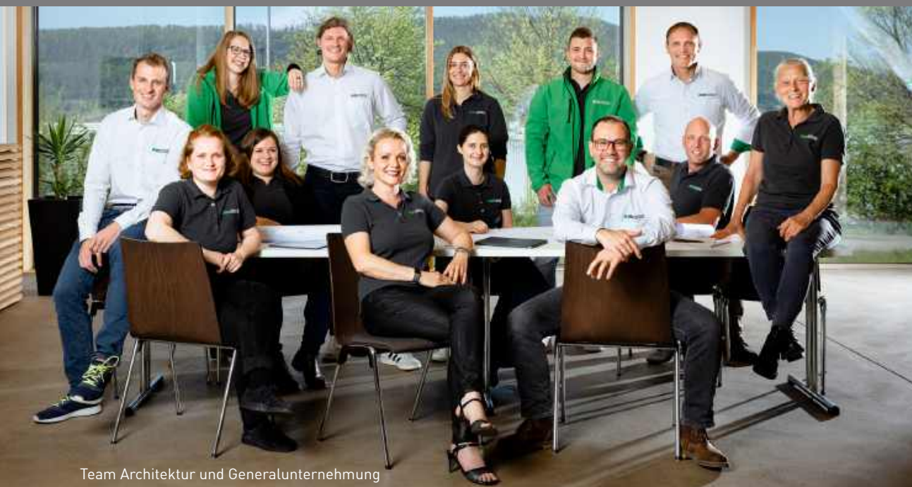
Team Architektur und Generalunternehmung